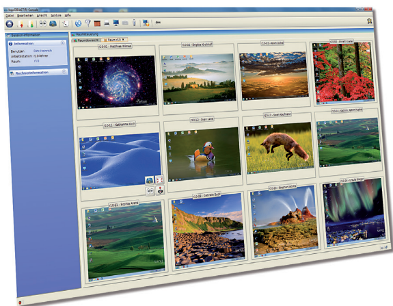
Bildschirmübertragung und -steuerung mit der IdConsole.

Über die pädagogische Oberfläche hinaus bietet logoDIDACT® Grundfunktionen für das digitale Lernen. Die Benutzerverwaltung ist in logoDIDACT® einheitlich in einer zentralen LDAP-Datenbank konzentriert, so dass keine separaten Benutzer in „Moodle“ oder anderen Anwendungen gepflegt werden müssen. Eine Anbindung an eine andere externe Lernplattform ist problemlos möglich.